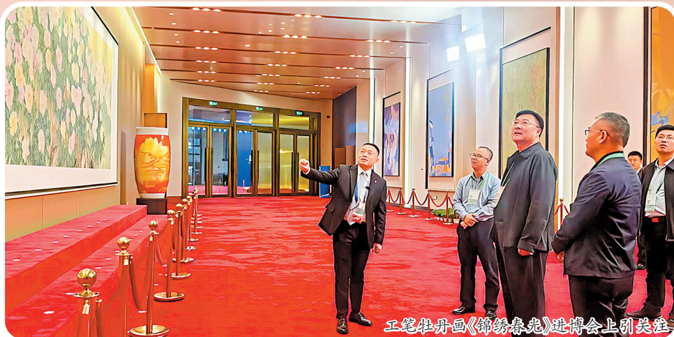
工笔牡丹画《锦绣春光》进博会上引关注