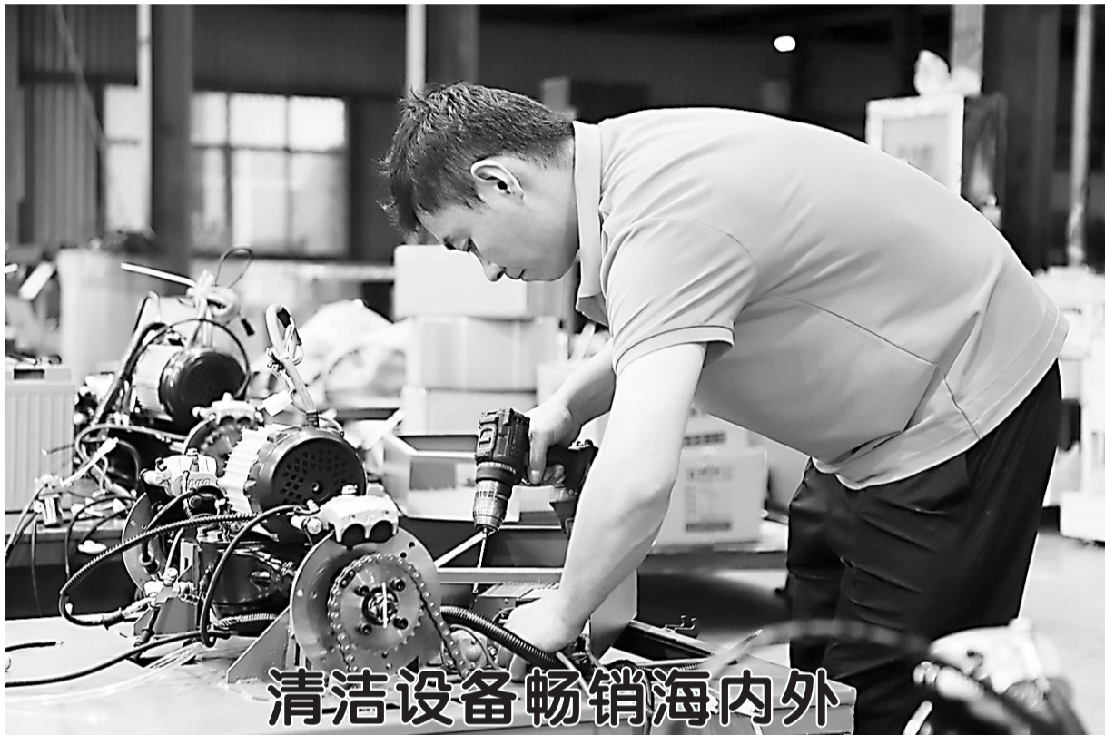
清洁设备畅销海内外

▲近日,记者在英士德清洁设备有限公司生产车间看到,工人正在紧锣密鼓地进行加工组装。据了解,该企业位于成武县,是一家专业的环卫设备制造商。公司主打电动扫地机、洗地机等产品,广泛应用于工厂、学校、医院、物业及市政街道等多个领域。凭借过硬的产品质量,英士德品牌不仅在国内市场享有盛誉,更成功扬帆出海,远销至巴基斯坦及东南亚地区,展现出强劲的市场竞争力与品牌活力。