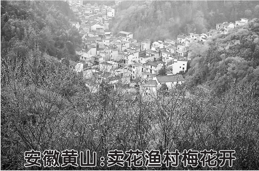
▲2月9日拍摄的歙县卖花渔村景色。近日，在安徽省黄山市歙县雄村镇卖花渔村，漫山遍野的梅花绽放，花海与徽派村落民居相映成趣，景美如画。

“忘记历史就意味着背叛，否认罪责就意味着重犯。”林剑说，今年是东京审判开庭80周年。在这一特殊年份，日本尤其应当正视和反省侵略历史，在靖国神社等重大历史问题上谨言慎行，不要重蹈覆辙，以实际行动同军国主义彻底切割。