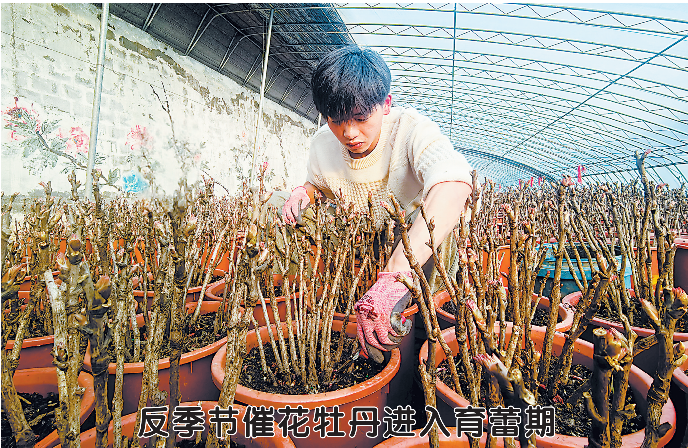
反季节催花牡丹进入育苗期