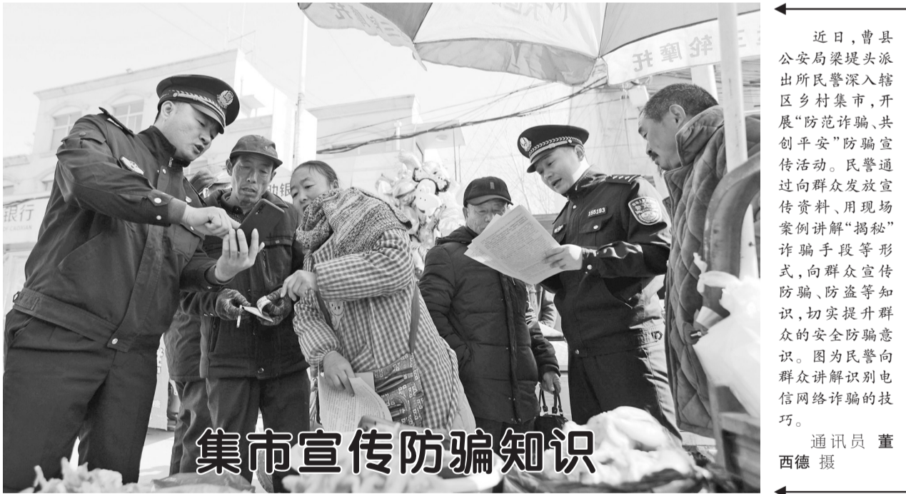
集市宣传防骗知识

近日,曹县公安局梁堤头派出所民警深入辖区乡村集市,开展“防范诈骗、共创平安”防骗宣传活动。民警通过向群众发放宣传资料、用现场案例讲解“揭秘”诈骗手段等形式,向群众宣传防骗、防盗等知识,切实提升群众的安全防骗意识。图为民警向群众讲解识别电信网络诈骗的技巧。